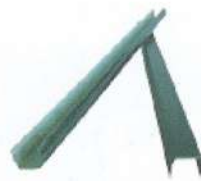
Profil de REMPLISSAGE