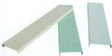
Profil de LAME