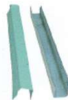
Profil de BORD