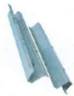
Rail de suspension